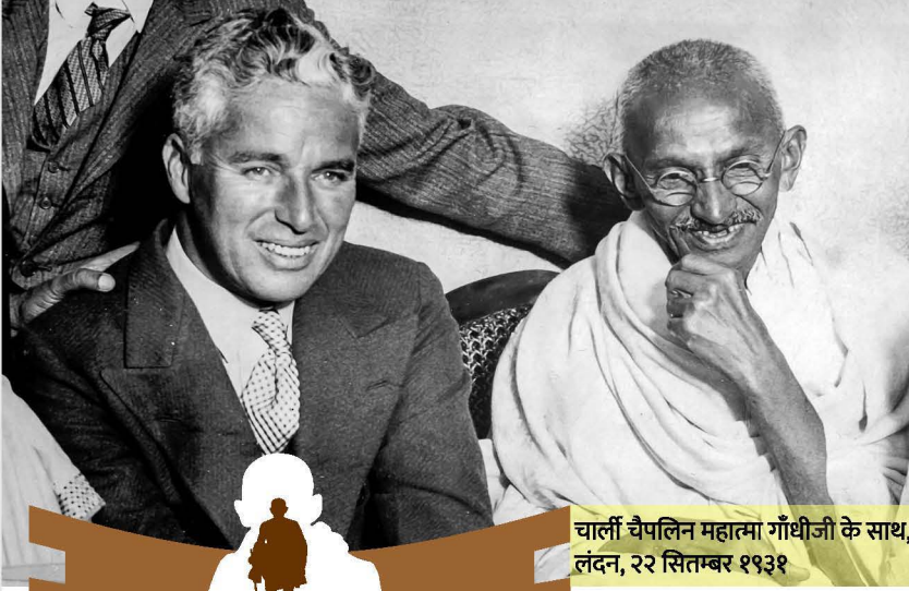
चार्ली चैपलिन महात्मा गाँधीजी के साथ, लंदन, २२ सितम्बर १९३१

महात्मा गाँधी ने अपनी कृति तथा विचार के जरिए कई क्षेत्र में अपना प्रभाव डाला है। बात आरोग्य की हो, पर्यावरण की हो, साहित्य की हो, जीवनशैली की हो, धर्म व अध्यात्म की हो, व्यवस्थापन व प्रशासन की हो, स्वाभाविक रूप से यह सूची लंबी हो सकती है। उनमें एक क्षेत्र अभिनय व कला भी है, इस क्षेत्र ने गाँधीजी को बचपन से प्रभावित किया है। बापू कोई अभिनेता नहीं थे किंतु उन्होंने इस क्षेत्र के कई दिग्गजों को प्रेरित किया है। महात्मा गाँधी का व्यक्तित्व इतना विशाल था कि किसी भी कलाकार को प्रेरित करने के लिए काफी है। उनके जीवन पर कई फिल्म बनी है तथा कई नाटक लिखे गए हैं। आज भी बापू के जीवन पर कई नाटक लिखे जाते हैं, कई बच्चे और बड़े बापू के जीवन पर बने नाटक का मंचन करते हैं।